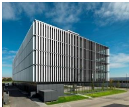
BFFT-Zentrale in Gaimersheim bei Ingolstadt.